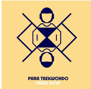
PARA TAEKWONDO PARIS 2024

https://france-paralympique.fr/sport/para-taekwondo/