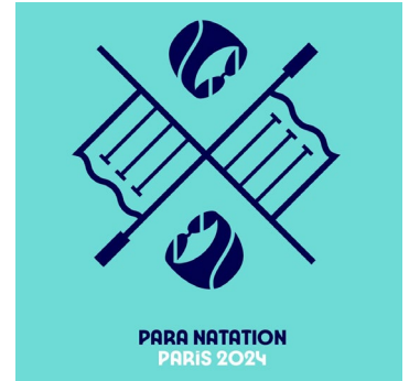
PARA NATATION PARIS 2024

https://france-paralympique.fr/sport/para-natation/