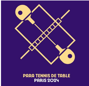
PARA TENNIS DE TABLE PARIS 2024

https://france-paralympique.fr/sport/para-tennis-de-table/