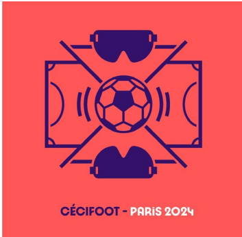
CÉCIFOOT - PARIS 2024

https://france-paralympique.fr/sport/football-a-5/