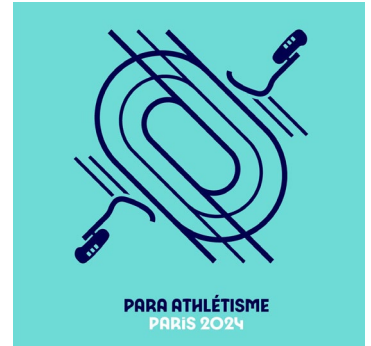
PARA ATHLÉTISME PARIS 2024

https://france-paralympique.fr/sport/para-athletisme/